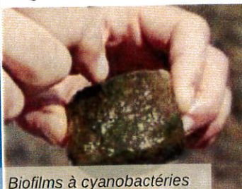
Biofilms à cyanobactéries

L'emmener rapidement chez un vétérinaire, si possible en ayant récupéré les éventuelles vomissures